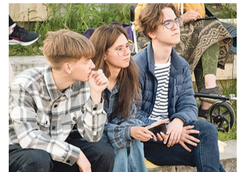
Культурное лето в муниципалитете № 72 в самом разгаре

Д обрая традиция активного вечернего отдыха зародилась в муниципалитете № 72 в минувшем году. Пилотными проектами стали кинопоказы и караоке. Они привлекли жителей, и ступеньки Купчино-арены никогда не оставались пустыми. А когда лето кончилось, купчинцы попросили муниципалитет продолжить мероприятия следующим летом.