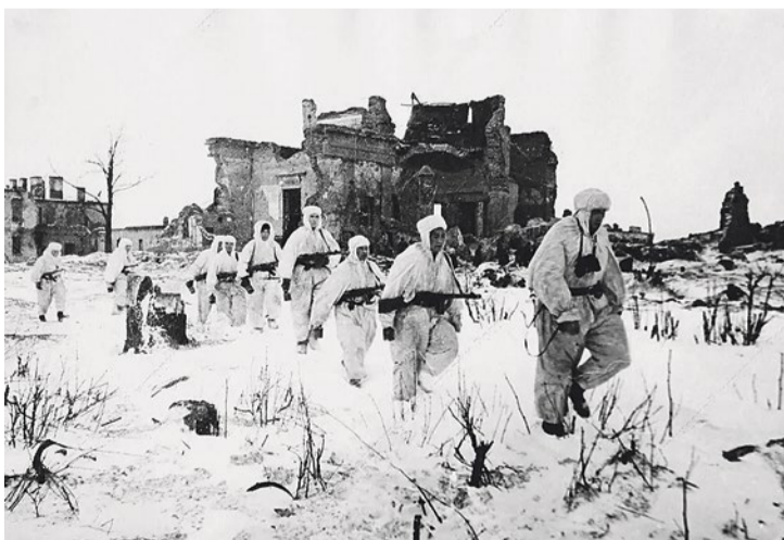
Пулковская обсерватория, 1942 год