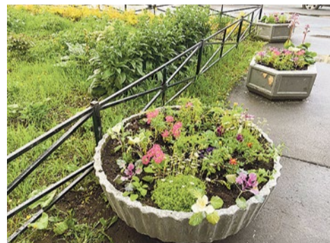
Посадка цветов в вазоны