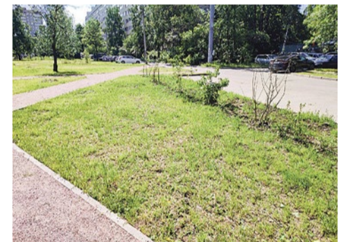
Посадка сирени на улице Пращской, 25