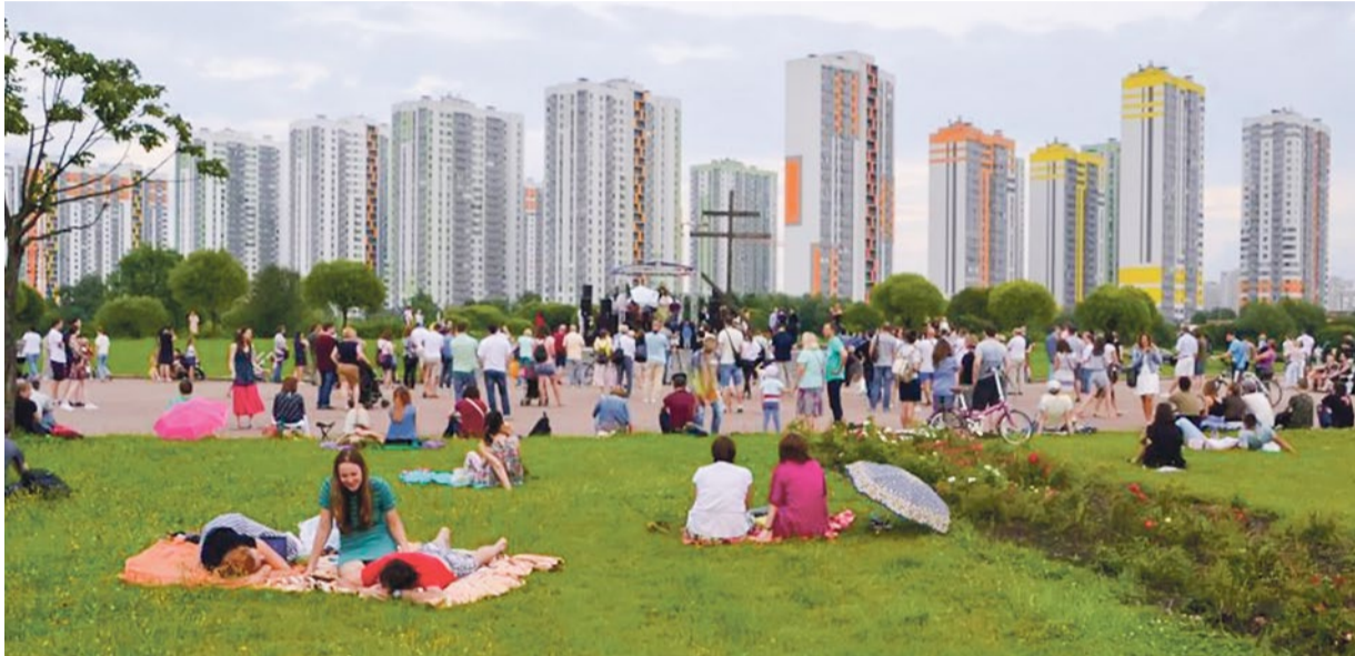
Фото с первого фестиваля «Белые ночи в Купчино», который прошел в 2018 году

30 июля в парке Интернационалистов весь день будет звучать музыка – здесь пройдет... нет, прогремит литературно-джазовый фестиваль «Белые ночи в Купчино». А каким он будет, организаторы поведали на пресс-конференции, которая прошла 24 мая в библиотеке имени Чехова на улице Турку.