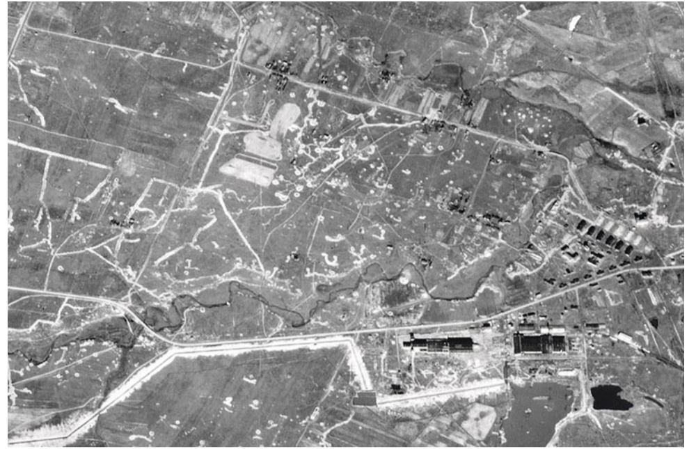
Местность около Рылеево на немецкой аэрофотосъемке. 1942 год