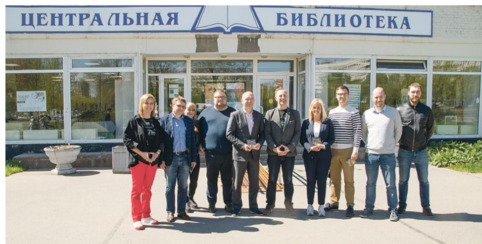
Пресс-конференция, посвященная фестивалю «Белые ночи в Купчино – 2022»