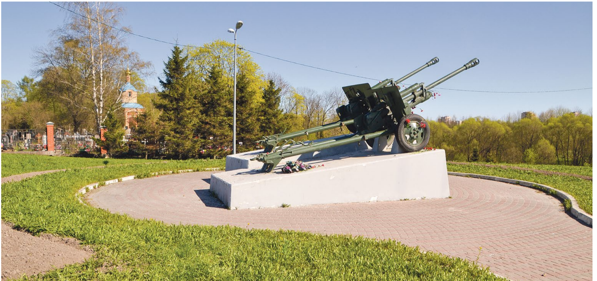
76-мм орудия ЗИС-3 у мемориала «Ополченцы», Пушкин, Петербургское шоссе, 20, к. 1