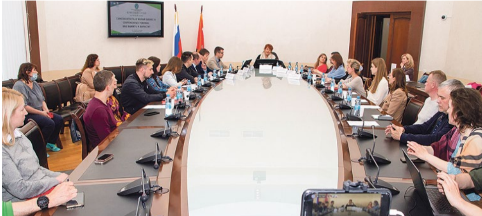
Участниками встречи стали ведущие петербургские специалисты

Круглый стол – это обмен знаниями и опытом, поиск решения проблем. 26 мая в День предпринимателя он объединил успешных бизнесменов, экономистов, специалистов по консалтингу и молодых купчинцев, готовых начать или уже открывших свое дело.