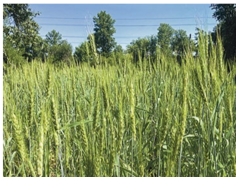
Пшеница на Злаковом поле, Софийская, 20/4