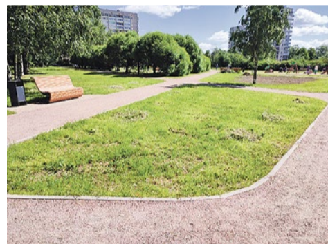
Газон в сквере на улице Пращской, 25