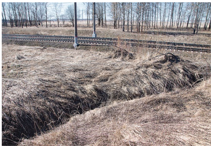
Александровская. Немецкая траншея на Аппендиките