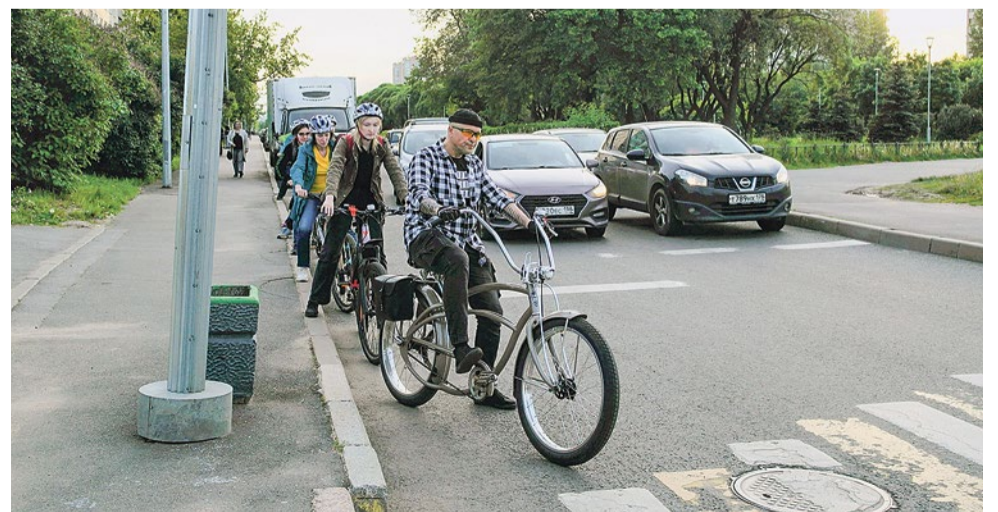
Знакомство с «большой дорогой»